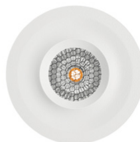
Lark-111 · HONEYCOMB LOUVER