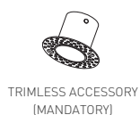
TRIMLESS ACCESSORY (MANDATORY)