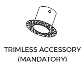
TRIMLESS ACCESSORY (MANDATORY)